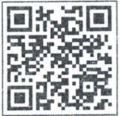
สมัครอบรม