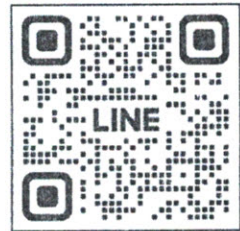
สอบถามข้อมูล

กองคลัง มหาวิทยาลัยราชภัฏสวนสุนันทา โทร. ๐๘ ๕๕๓๐ ๒๔๒๔