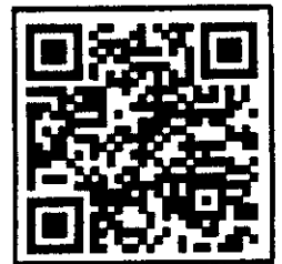
เว็บไซต์